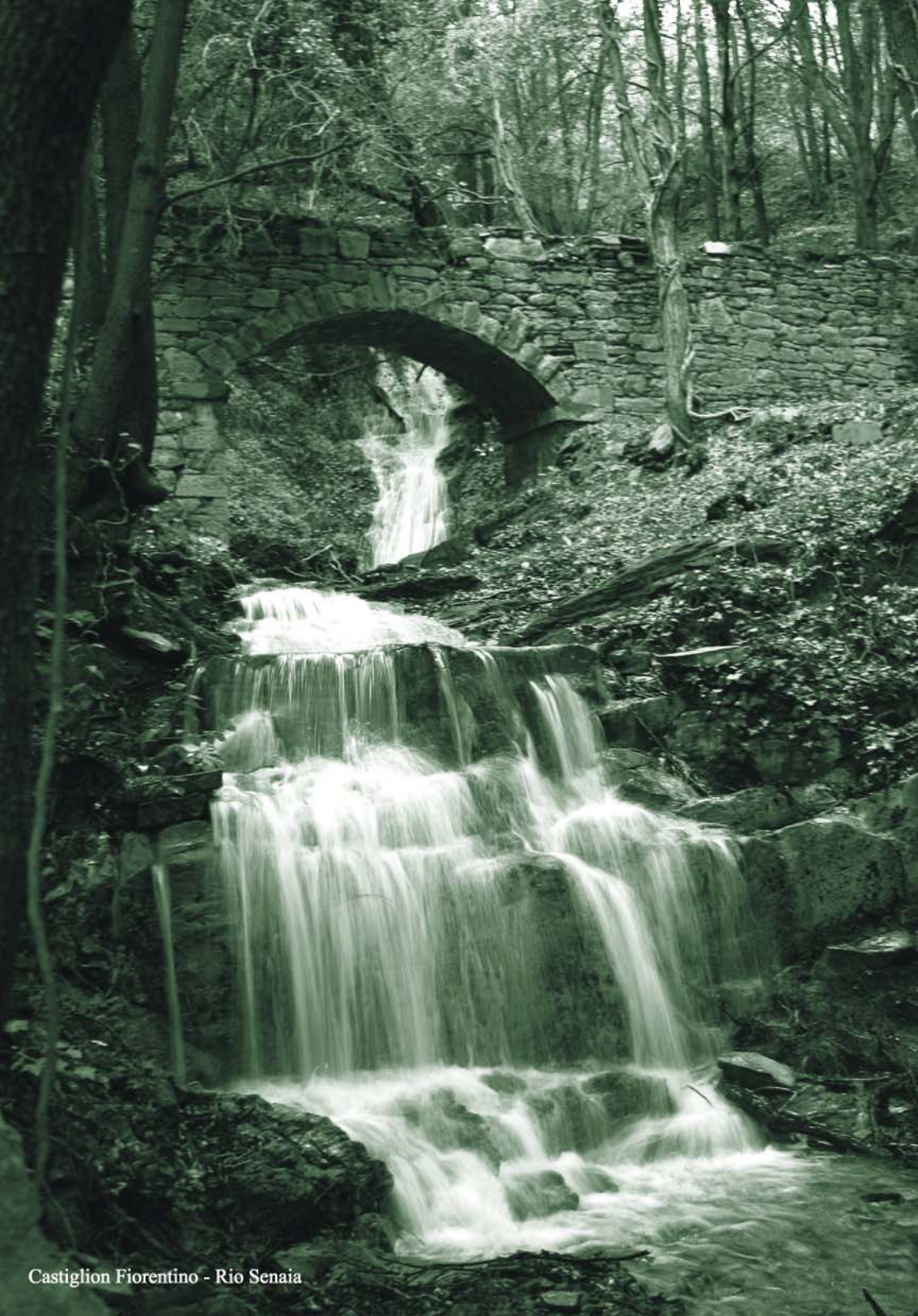
Castiglion Fiorentino - Rio Senaia